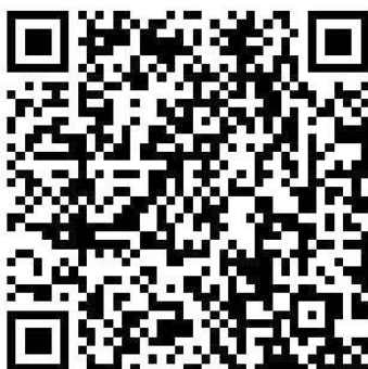
案例申报操作手册

智慧企业建设创新案例申报企业须通过“中国企联智慧企业建设创新案例申报（ https://www.oilint.com/cecpt/caselogin.jsp ）”按要求线上填报申报书与案例报告，推荐单位同意推荐，中国企业联合会审核手续无误后，纳入本届遴选。申报系统自即日起至 2026 年 7 月 31 日开放，逾期无法填报、推荐，请申报企业、推荐单位务必在开放期间完成填报、推荐工作。申报系统使用说明请扫码下载。