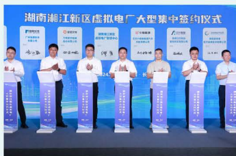
▲ 湘江新区虚拟电厂签约仪式