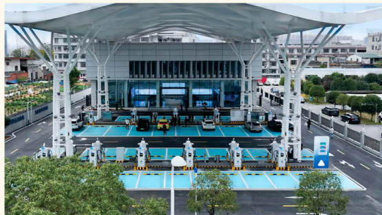
▲湖南首座实现源网荷储一体化的综合服务中心——长沙梨架智能充电站

大力推广配网不停电作业，全年开展带电作业10515次，多供电量超3000万千瓦时。为加快推进新兴产业发展，目前电动汽车充电站点建成258个、充电桩2056个，覆盖长沙城区及各区县。