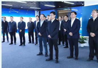
▲ 湖南省副省长、党组成员曹志强出席临空经济示范区成果发布会

持续深化“政企合作、共建电网”长沙模式，推动韶山路电力隧道等关键项目配套廊道投资全部纳入政府预算。按期投运220千伏天顶变原址重建等重点工程36项，首获国网公司优质工程奖。