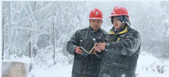
▲ 在浏阳焦溪岭监测电力设施覆冰情况