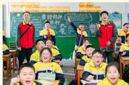
▲ 青春携手护童心，电力科普进校园

大力开展供电服务“大整治”行动，累计实施服务履职“驾照式”记分110人次、332分。深化供电服务渠道建设，供电服务窗口进驻11家区县级政务服务中心。