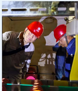
▲ “防汛保电”党员突击队驰援平江受灾现场