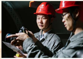
▲认真开展度夏线路特巡