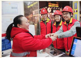
▲“电雷锋”为客户进行安全用电检查