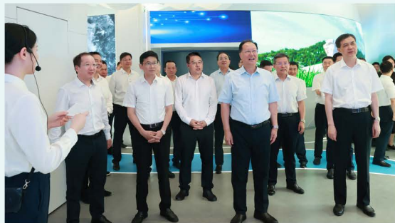
▲ 湖南省委副书记、省长毛伟明调研长沙橘子洲零碳能源体验厅