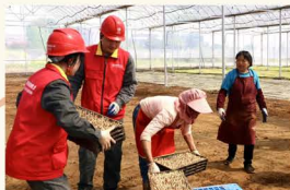
▲ “电雷锋”助春耕，用心服务“零距离”