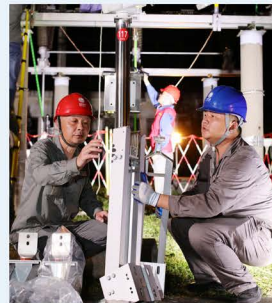
▲ 众志成城鏖战抢修，确保电力迎峰度夏