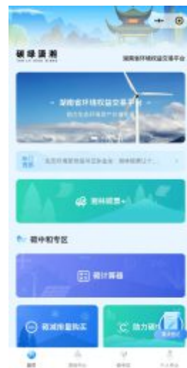
湖南省环境权益交易平台暨湖南省绿色金融综合服务平台上线 “碳绿潇湘”小程序