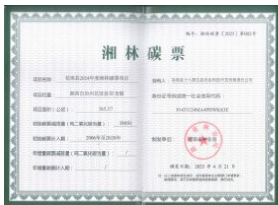
花垣县湘林碳票凭证

湖南联交所深度挖掘“湘林碳票”的多元价值，加大拓展“碳票+司法”“碳票+旅游”“碳票+碳中和”“碳票+金融”等创新应用场景，促成工行湘西分行在花垣县湘林碳票应用先行区落地全省首笔300万元的湘林碳票质押贷款，开创了湖南“森林资源-碳资产-金融资产”的价值转化新路径。