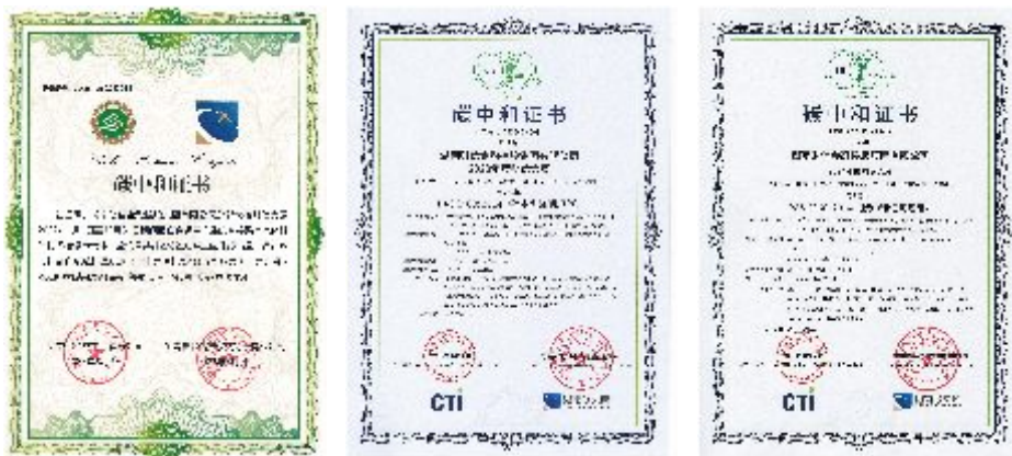
2022—2024年财信大厦碳中和证书

财信金控将低碳理念深度融入经营管理全流程，通过不断推进低碳运营、执行绿色办公、宣传减碳理念等方式推进节能减碳。2024年，财信总部大楼财信大厦连续第三年实现碳中和，是“湖南首座碳中和总部大楼”。财信金控也成为“全国首个实现总部运营碳中和的金控公司”。期间，财信金控发出“财信大厦及其他办公场所低碳运营‘八倡议’”，从办公、通勤、能源等维度鼓励集团员工积极参与减碳行动。