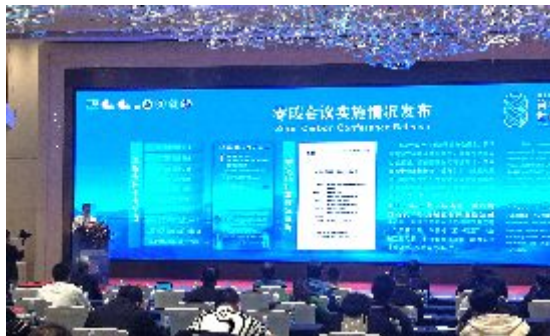
支持第八届联合国教科文组织世界地质公园管理和发展培训班

基础，成功举办湖南省首期碳资产管理、碳金融等专业培训。深度参与省级党政干部、工业节能、林业碳汇、检察机关公益诉讼等领域的双碳专题培训授课。截至2024年底，累计开展能力建设活动10余次，覆盖企业超300家、人员1300余人次，显著提升了区域碳管理专业水平。